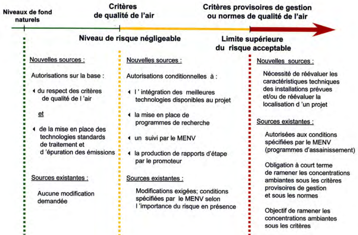
Figure 3.1 : Exigences relatives aux sources d'émission.