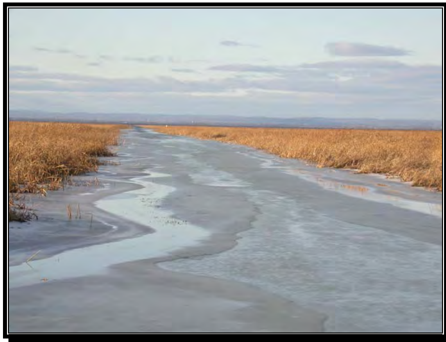
FIGURE 2 : CHENAL LANDROCHE DÉLIMITÉ PAR LES HERBIERS (VERS LE FLEUVE)