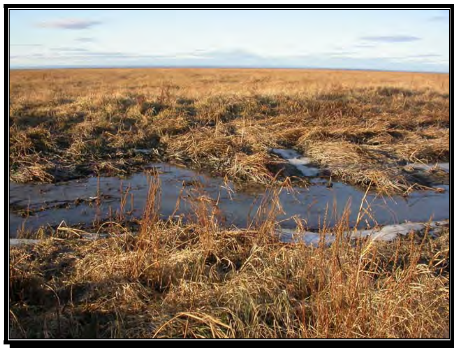
FIGURE 4 : PROFONDEUR DU CHENAL LANDROCHE À L'AUTOMNE

Source : MDDEP (Jean Sylvain), automne 2004