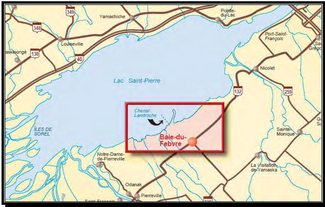
FIGURE 1 : LOCALISATION DU PROJET